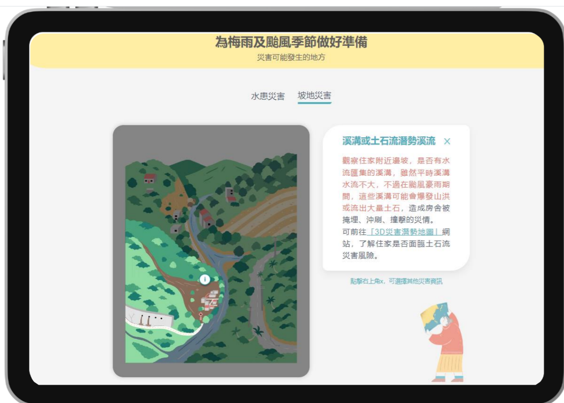
▲藉由圖像與互動效果提升學習效果