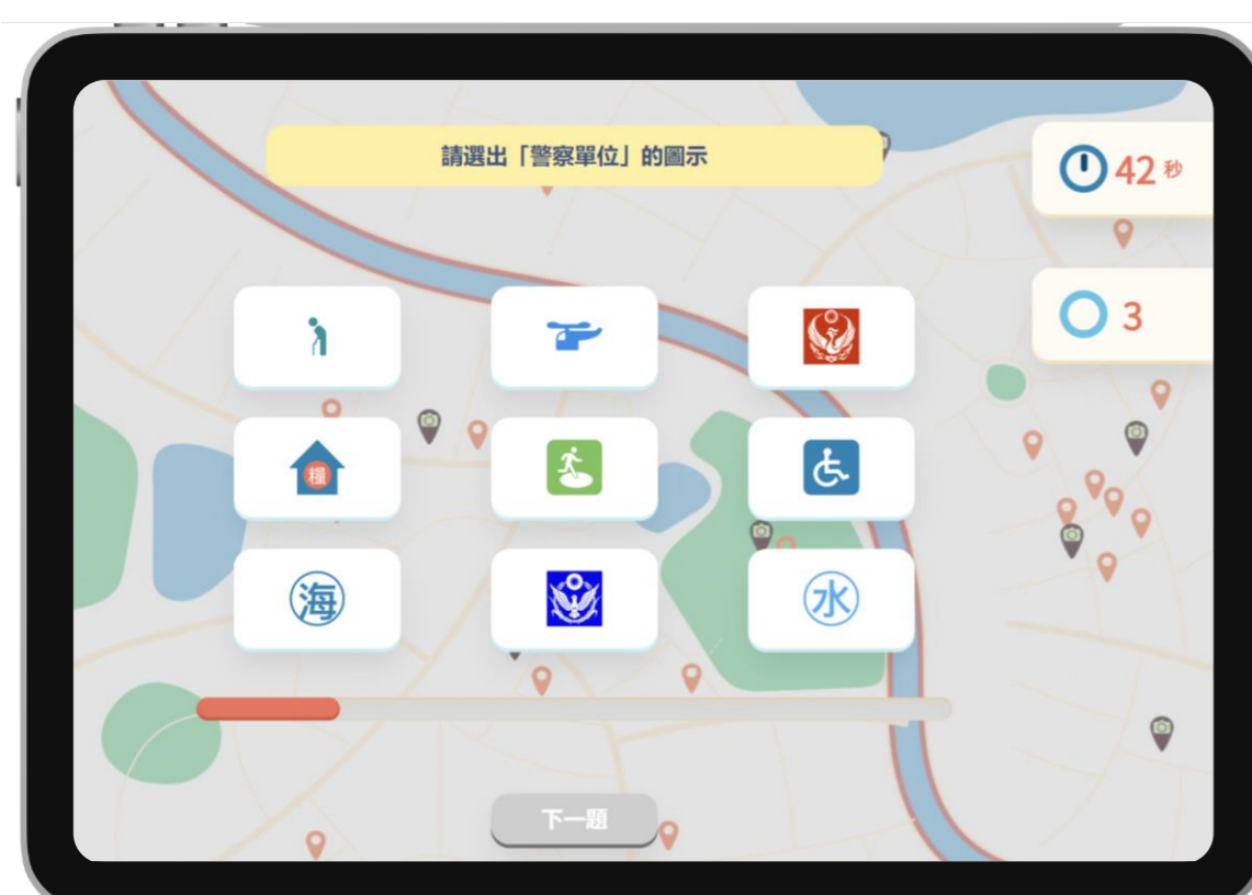
▲「防災地圖猜猜樂」遊戲