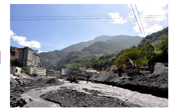
拍攝日期：2009/09/10 影像事件：2009莫拉克颱風