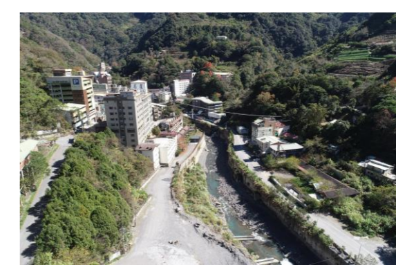
拍攝日期：2021/01/21 環境調查