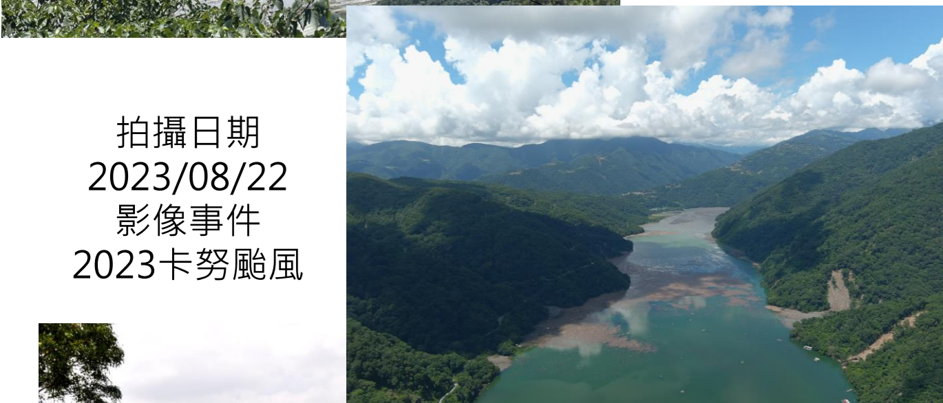
拍攝日期 2023/08/22 影像事件 2023卡努颱風