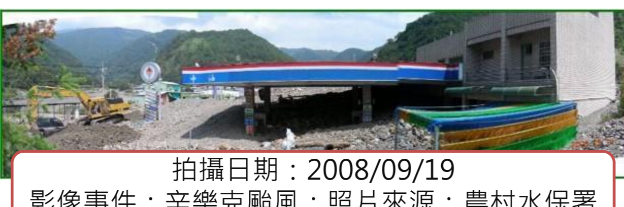
拍攝日期：2008/09/19 影像事件：辛樂克颱風；照片來源：農村水保署