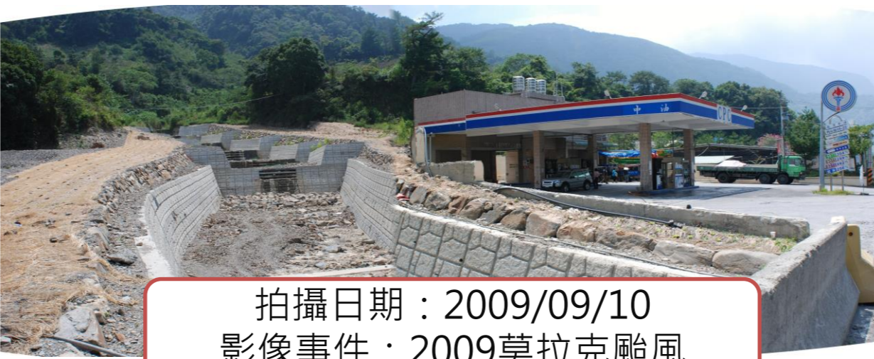
拍攝日期：2009/09/10 影像事件：2009莫拉克颱風