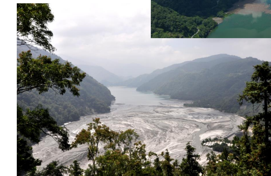
拍攝日期 2009/09/10 影像事件 2009莫拉克颱風