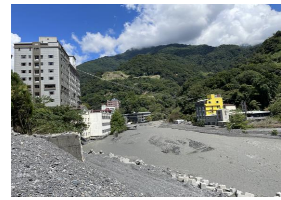
拍攝日期：2023/08/22 影像事件：2023卡努颱風