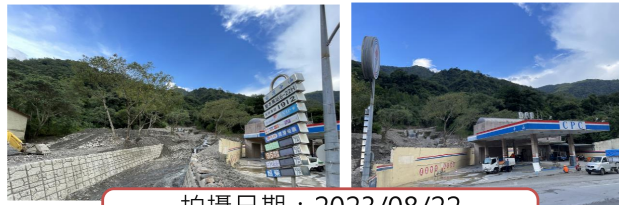
拍攝日期：2023/08/22 影像事件：2023卡努颱風