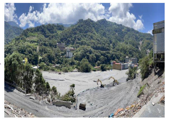
拍攝日期：2023/09/12 影像事件：2023海葵颱風