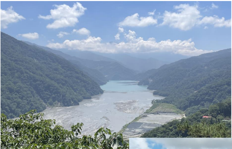
拍攝日期 2023/09/12 影像事件 2023海葵颱風